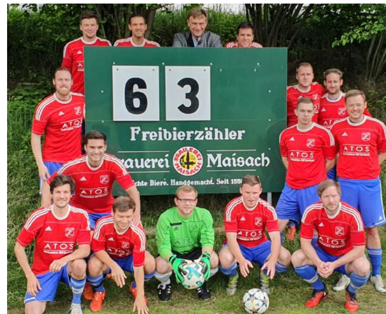
1. Mannschaft mit dem Freibierzähler (für jedes geschossene Tor einen Liter) am 26.05.2019.

Das erste Spiel wurde beim VSST Günzlhofen mit 4-3 gewonnen, gegen den Gautinger SC gab es eine unnötige 2-3 Niederlage und beim TSV Moorenweis war leider ebenfalls nichts zu holen.